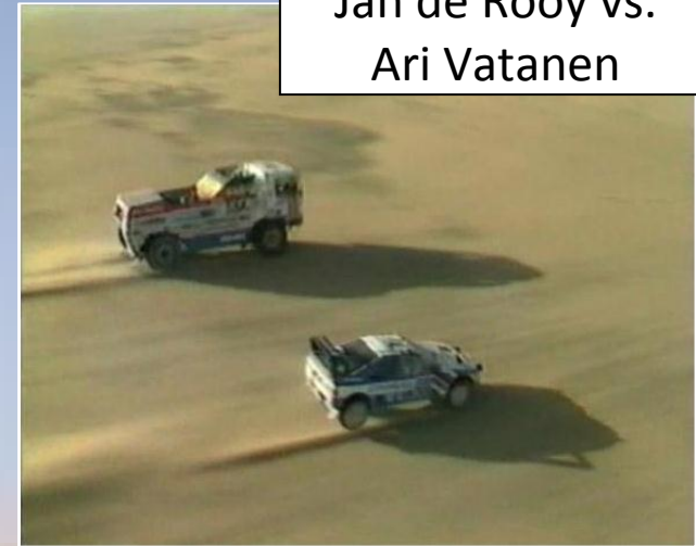
Jan de Rooy vs. Ari Vatanen