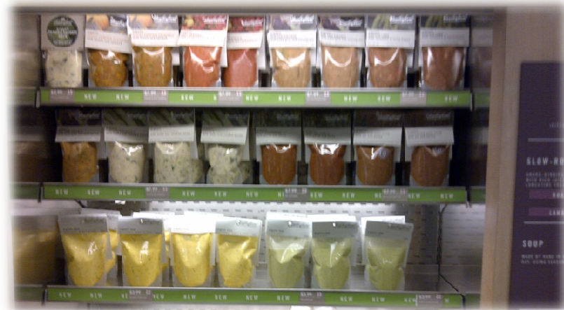
Holanda, junio 2012