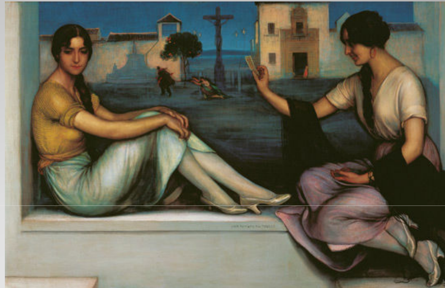
Julio Romero de Torres La Buenaventura, 1922